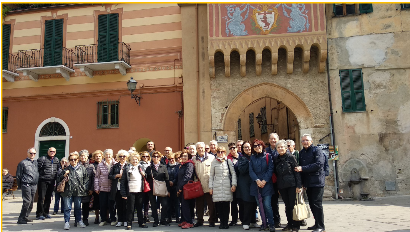
La gita dei Seregnesi in una delle porte di ingresso di Finalborgo